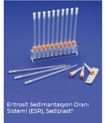
Eritrosit Sedimentasyon Oranı Sistemi (ESR), Sediplast®

Pipet Uzunluğu : 200 mm İç çap : 2.5 ± 0.15 mm Çap toleransı : ±0.05 mm Taksimatlandırma : 0-150 ± 0.35 mm